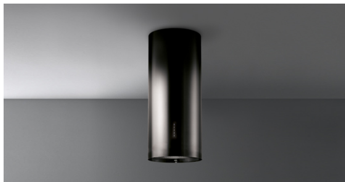
Fotografiet er udelukkende informativt Korresponderer ikke nødvendigvis tmed den valgte model